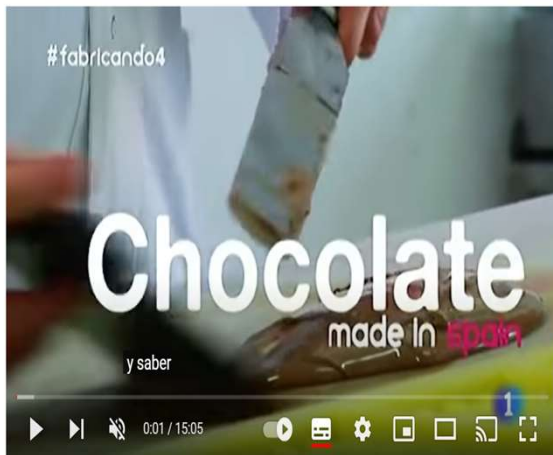
25-Fabricando Made in Spain - Tableta de chocolate